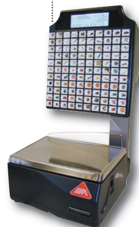
JUPITER 110 TOUCHES