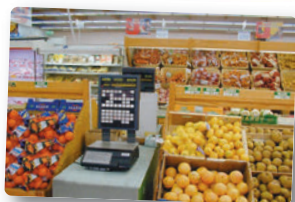
FRUITS / LÉGUMES

Vous disposez désormais d'une solution de pesage et de gestion commerciale «clé en main», conforme à la réglementation dans le cadre de la métrologie légale, vous permettant de gagner en performance de gestion et en qualité de service.